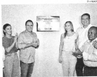
Prefeito Edivaldo Jr. e comitiva entregaram prédio à comunidade