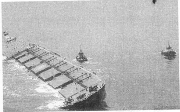
Navio cargueiro sul-coreano deixaria o Maranhão e com destino o porto de Qingdao, na China

De acordo com a Vale, a solicitação dos navios foi prontamente atendida pela Petrobras. Essas embarcações Oil Spill Recovery Vessel são destinadas ao recolhimento de óleo vazado em regiões oceânicas. Nesse sentido, é uma ferramenta que evita a dispersão do material na água do mar, pois apresenta boa capacidade de manobra garantida pelo uso de propulsores azimutais. O veículo proporciona melhor resposta ao equipamento, uma vez que contém equipamentos específicos e de alta tecnologia para detectar, aspirar e armazenar o material.