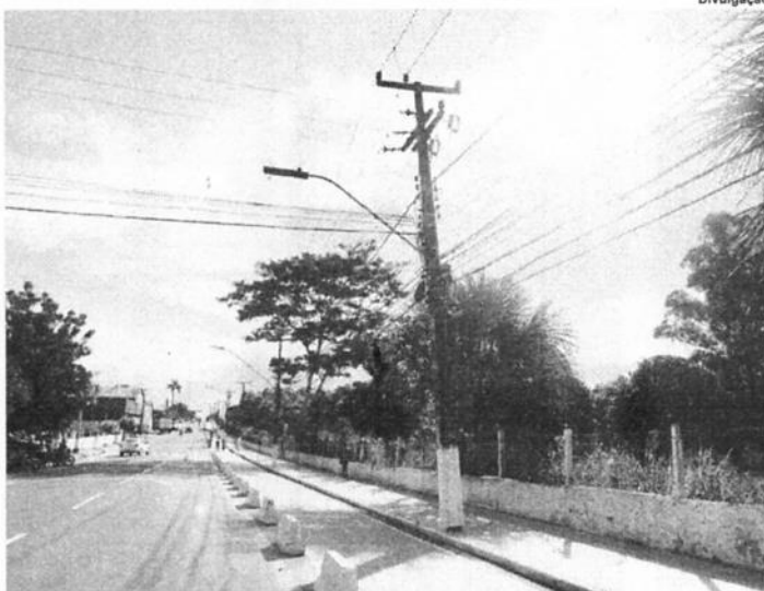
A Iluminação Pública é um serviço de grande importância para a segurança e qualidade de vida da população.