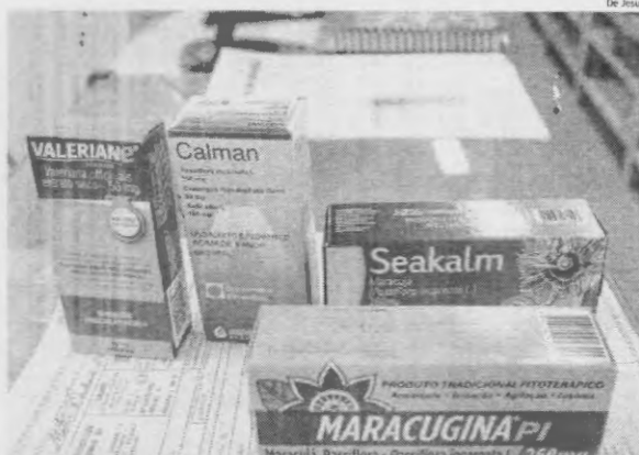
Medicamentos à base de vegetais aliviam a ansiedade e são os mais procurados durante a pandemia

Em uma das farmácias visitadas por O Estado, a atendente