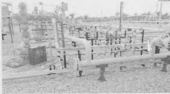
Estação de Produção de Gavião Branco (EPGVB), da Companhia Eneva, localizada na Bacia do Parnaíba

As descobertas offshore foram feitas pela Shell (1) Aho de Cabo Frio