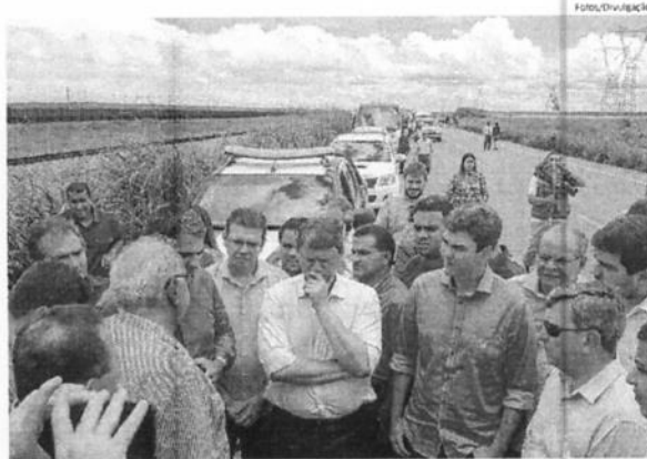
Ministro Tarcísio Freitas já esteve na BR-135 no início de 2019 para verificar a situação, da rodovia

No início da tarde de ontem, 29, o coordenador do grupo de deputados federais e senadores do estado, Juscelino Filho (DEM), publicou nas redes sociais que o ministro Tarcísio Gomes de Freitas, titular da Infraestrutura do governo Jair Bolsonaro, garantiu "entregar uma rodovia bem melhor". De acordo com o democrata, em contato com O Estado, antes das intervenções, operações tapa-buraco deverão ser feitas com o objetivo de minimizar os impactos das chuvas na malha rodoviária.