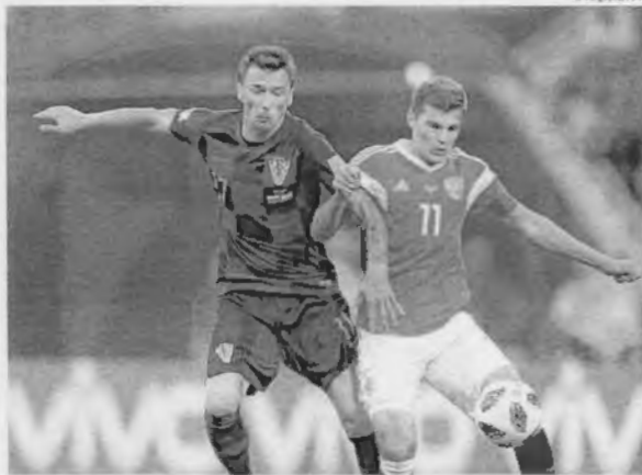
Mario Mandzukic elogiou os jovens croatas e descartou favoritismo da sua seleção na semifinal