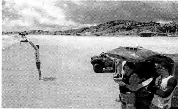
Pelo controle remoto bombeiro guia drone, que levará boia para pessoa em situação de afogamento

Ele informou que esse tipo de procedimento é seguro, principalmente, no resgate quando a vítima ainda está consciente. "O drone é controlado por um bombeiro e consegue levar o flutuador até a vítima e, logo após, entra a ação do salva-vidas", explicou o major.