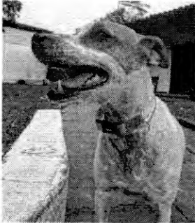
Princesa engordou durante o período de isolamento social; Anakin ganhou brinquedos para gastar energia

Uma das medidas de prevenção contra a doença é evitar a saída de casa e o uso dos equipamentos adequados de proteção individual, como máscaras e álcool em gel. Isso restituiu na rotina dos animais justamente por seus donos não poderem os acompanhar em passeios, e os petshops estarem abertos apenas para emergência. Contudo, com a flexibilização na capital maranhense que se iniciou em junho