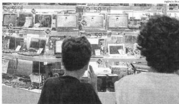
A parcela de brasileiros que avaliou o momento como positivo para comprar bens duráveis atingiu 34,6%.

“Os resultados estão alinhados com uma melhora da percepção econômica, já sinalizada pelo aumento da confiança dos empresários do comércio, que também teve seu melhor janeiro em anos. Os indicadores medidos neste primeiro mês traduzem uma recuperação gradual, impulsionados pela infla-