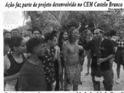
Estudantes conheceram a comunidade krahô de Itacajá

Um grupo de 45 alunos do Centro de Ensino Médio Castelo Branco, em Araguaína, viajou na última quarta-feira (08/11) para a comunidade indígena dos krahô, em Itacajá, região norte do estado.