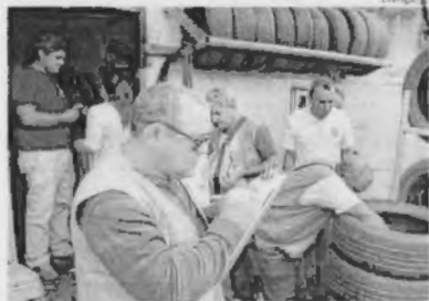
Agentes da Prefeitura vistoriam borracharia no bairro Vinhas

Os que comprovem seu direito a isenção. Mesmo aqueles candidatos que tentaram o pedido de isenção e não precisaram fazer a inscrição, isentos ou não, todos os participantes do Exame Nacional do Ensino Médio 2018 devem se inscrever no dia do Enem entre os dias 7 e 18 de maio.