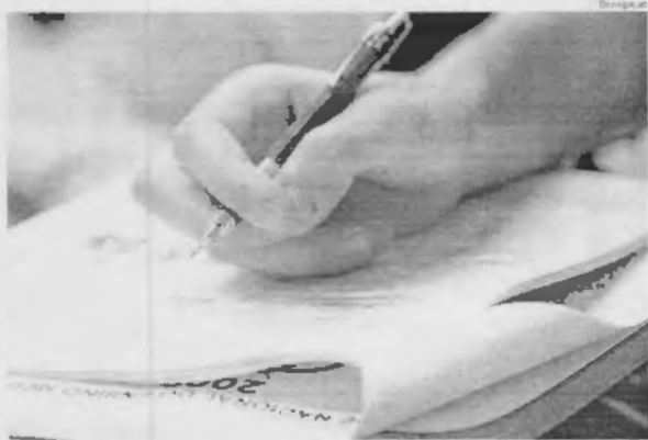
As provas do Enem deste ano serão aplicadas nos dias 4 e 11 de novembro, de acordo com o Inep

Quem pode pedir isenção Nesta edição, o valor a ser pago para fazer a prova é de R$ 82.