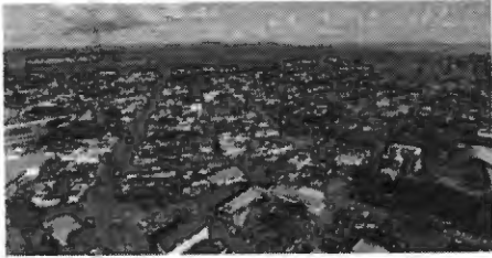
Porto Nacional também bateu recorde de exportações em 2023

O município de Porto Nacional está consolidado como a terceira maior economia do Estado. A cidade, que tem cerca de 64 mil habitantes e é a quarta em população do Tocantins, alcançou um Produto Interno Bruto (PIB) de R$ 3,65 bilhões em 2021, conforme dados divulgados pelo IBGE (Instituto Brasileiro de Geografia e Estatística) no final de semana.