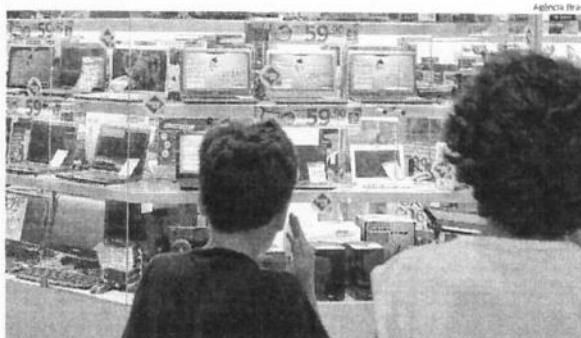
A parcela de brasileiros que avaliou o momento como positivo para comprar bens duráveis atingiu 34,6%.

“Os resultados estão alinhados com uma melhora da percepção econômica, já sinalizada pelo aumento da confiança dos empresários do comércio, que também teve seu melhor janeiro em anos. Os indicadores medidos neste primeiro mês traduzem uma recuperação gradual, impulsionados pela infla-