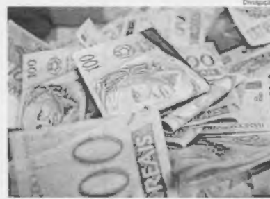
Dois em cada dez brasileiros contrataram algum tipo de empréstimo

A capacidade de pagamento das pessoas tem sido afetada pelo alto nível de desemprego. A renda das famílias continua reduzida, levando muitos brasileiros a fazer empréstimos para pagar contas ou mesmo quitar dívidas", destaca a