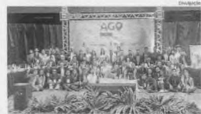
Jovens empresários durante assembleia geral, em Santa Catarina

O prêmio pelo engajamento foi resultado do trabalho de entidades ligadas à cultura empreendedora no estado, como a Associação dos Jovens Empresários do Maranhão (AJE-MA), o Conselho de Jovens