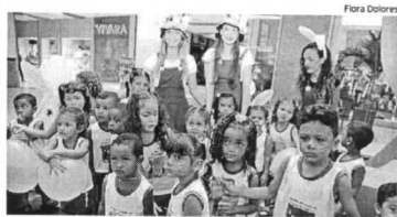
Grupo de crianças, ontem, na Praça de Eventos do São Luís Shopping

Foi um momento único para as crianças. Essa parceria maravilhosa proporcionou aprendizado, socialização e a gente agradece de