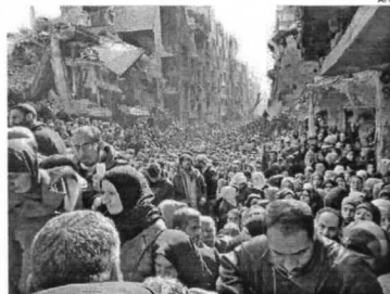
Campo de refugiados em Damasco que foi tomado ontem pelo EI