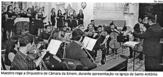
Maestro rege a Orquestra de Câmara da Emem, durante apresentação na Igreja de Santo Antônio