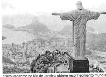
Cristo Redentor, no Rio de Janeiro, obteve reconhecimento mundial

pelo TripAdvisor com usuários brasileiros revelou que 60% consideram que é muito importante visitar uma atração turística durante uma viagem.