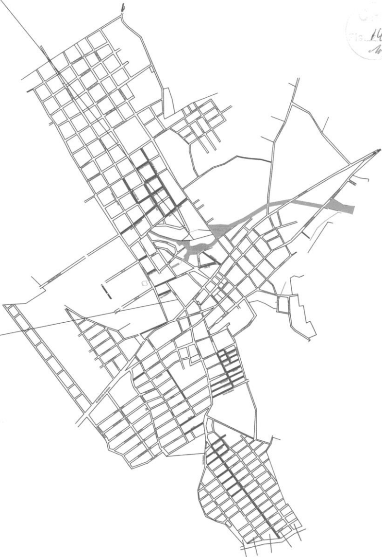
Fig. 143 M