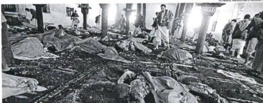
Mesquita atingida por homem-bomba em Sanaa, no Iêmen; mais de 100 pessoas morreram ontem

Apesar dos esforços das forças de segurança e dos ocidentais, a Al-Qaeda está se confirmando cada vez mais como a única força capaz de frear o avanço do Ansarullah.