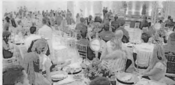
Momento da cerimônia de entrega do prêmio no ano passado reuniu representantes de empresas

De acordo com o GPTW, inspiração de funcionários, espaço para se desenvolver boas relações pessoais e profissionais, comuni-