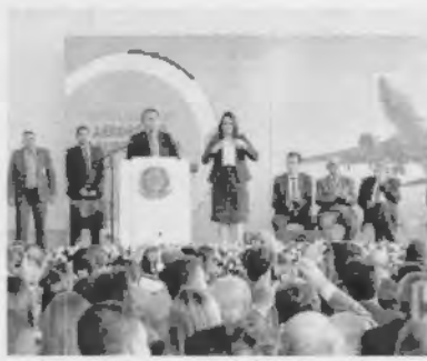
Presidente Jair Bolsonaro prometeu não deixar obras paradas no país

Na esperança, o governo Bolsonaro anunciou um bilionário adicional de R$ 1,4 bilhão no Orçamento e visou a previsão de crescimento da economia de 1,6% para 0,8%. Falando a apoiadores que aguardavam confinados numa espécie de