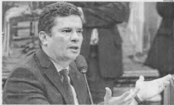
Cellular de Sergio Moro, segundo a PF, foi hackeado em uma ação orquestrada e que vem sendo investigada

A operação foi batizada de Spoofing ("falsificação tecnológica que procura enganar uma rede ou uma pessoa fazendo-a acreditar que a fonte de uma informação é confiável quando, na realidade não é", segundo a definição da Polícia Federal). O objetivo, informou a PF, é "desarticular organização