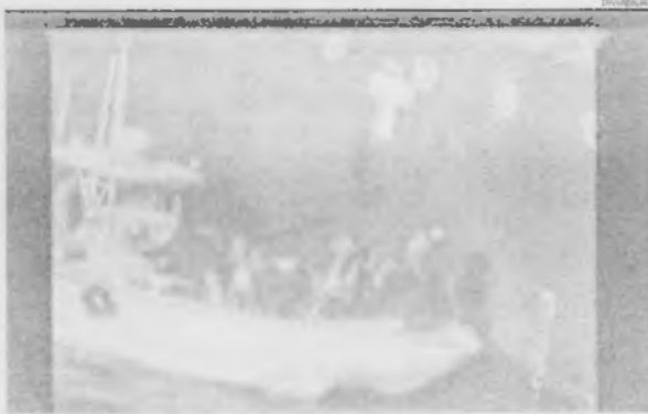
Imagem de vídeo mostraria integrantes da Guarda Revolucionária retirando uma mina do casco de navio

A tensão política e militar entre os Estados Unidos e o Irã aumentou nesta sexta-feira (14), com a divulgação pelo Pentágono de um vídeo que supostamente mostraria integrantes da Guarda Revolucionária iraniana retirando uma mina magnética do casco de um dos navios petroleiros atacados na manhã de quinta-feira (13), no Golfo de Omã. A acusação veiculada pelo governo americano foi indiretamente contestada pelo presidente da empresa operadora do navio, o Kishka Containers, segundo o qual a explosão foi provocada por um "objeto voador", e não uma mina.