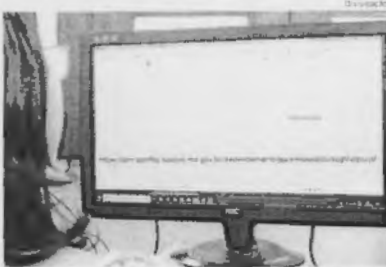
Contribuinte pode emitir primeira parcela do IPTU no site da Semfaz

Enfim, quem perde o prazo para pagamento da primeira parcela do IPTU em São Luís, não pode esquecer de pagar a multa de mora e juros.