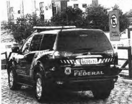
A ação é resultado de um trabalho conjunto entre a Polícia Federal e o MPF

Rio de Janeiro/RJ - Nesta quinta-feira, 14/7, a Polícia Federal deflagrou a Operação Conexão Miami, com objeti-