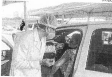
Idosa recebe dose da vacina contra o vírus H1N1 sem sair do carro

Continuou ontem a campanha de vacinação contra a gripe Influenza H1N1, por meio de sistema drive-thru, e foram vacinados 1.646 idosos, com mais de 60 anos, com inicias dos nomes F e E. O atendimento está sendo disponibilizado na área de provas práticas de Habilitação de condutores, do Departamento Estadual de Trânsito do Maranhão (Detran-MA), localizada no Castelinho, na Vila Palmeira.