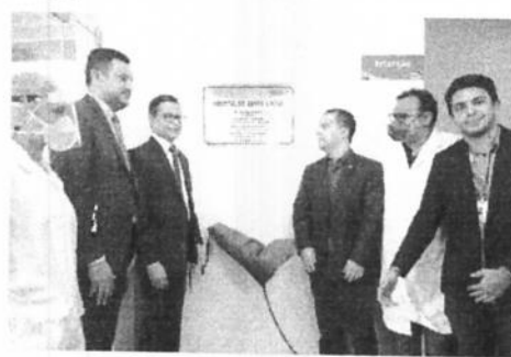
Gov. entrega 52 novos leitos exclusivos para assistência a pacientes com Covid-19

O interior do estado também possui leitos reservados para pacientes infectados pelo coronavírus e que precisem de atendimento hospitalar. Entre as unidades de saúde que possuem leitos para a assistência a pacientes com a Covid-19 estão o Hospital Macrorregional Dr. Everaldo Ferreira Aragão, em Caxias; o Hospital Regional Alarico Nunes Pacheco, em Timon; o Hospital Macrorregional Dra. Ruth Noletto, em Imperatriz; e o Hospital Macrorregional Alexandre Mamede Trovão, em Coratá. (Secap)