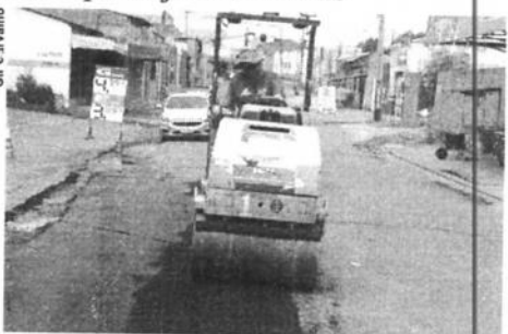
Equipe agilizadora recuperação da malha asfáltica na Rua Rui Barbosa, Vila Lobã