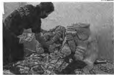
Policial Federal retira dinheiro de elefante de pelúcia, durante ação