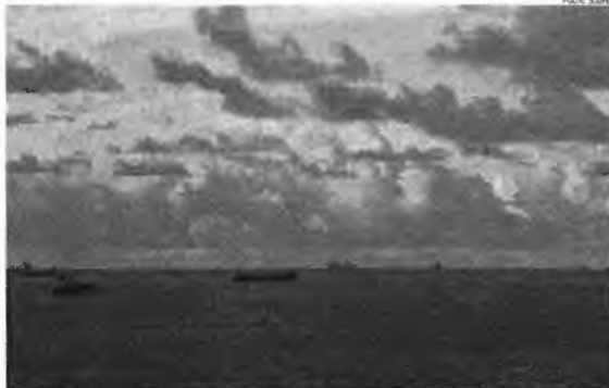
Navios fundeados na costa do Maranhão são de maioria estrangeira, segundo entidade do setor

Além de acordo com a Anvisa, as ações de vigilância sanitária estão sendo realizadas de forma intensificada nas embarcações que adentram os portos brasileiros, inclusive, na área portuária de São Luís. Este procedimento tem como objetivo de reduzir as chances de cir-