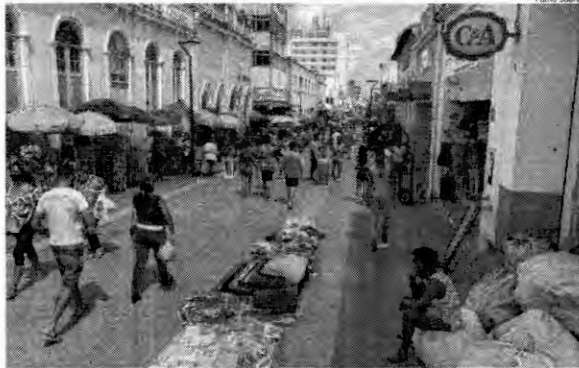
Comércio ambulante ocupa calçadas e frente de lojas; em bancas ou no chão, eles só querem vender